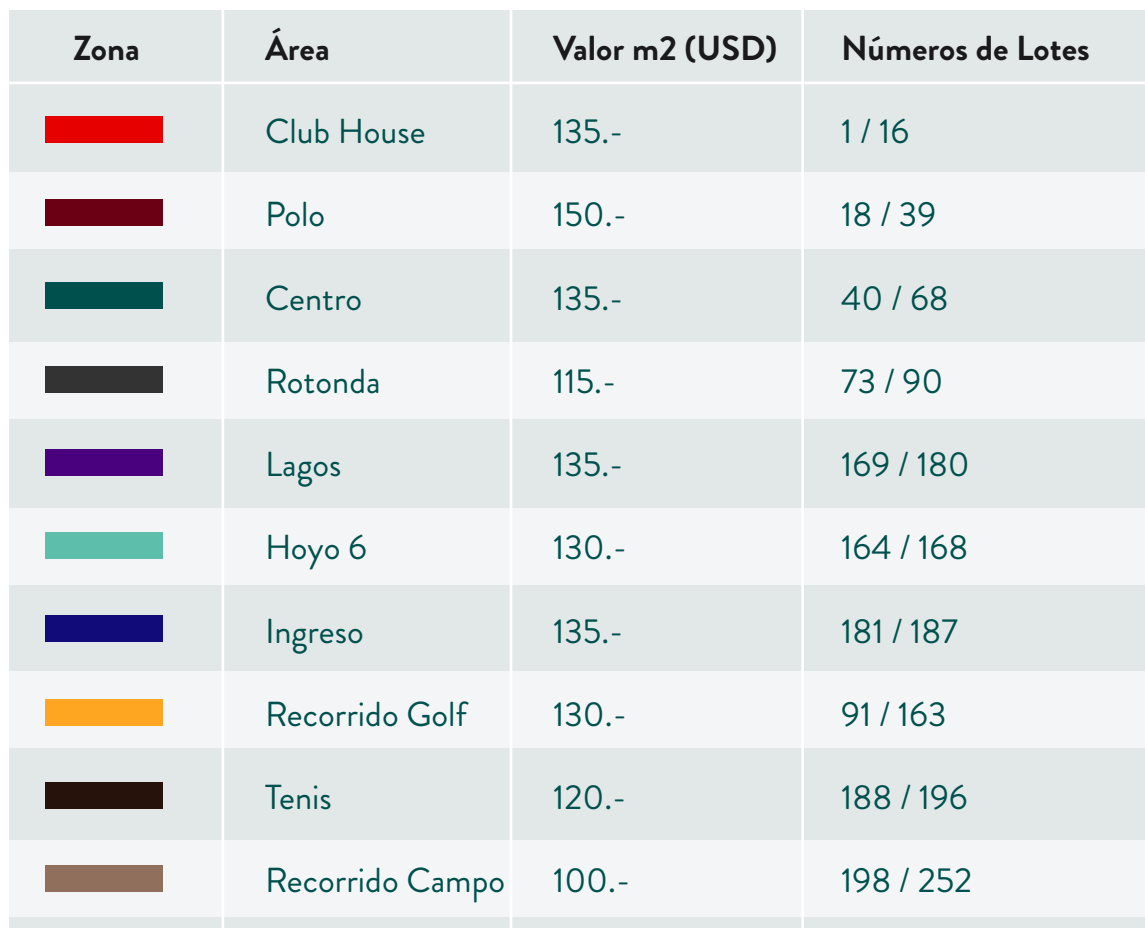
Tabla comparativa de lotes